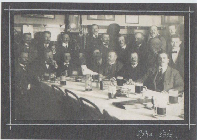
Schůze KT Noha v roce 1912